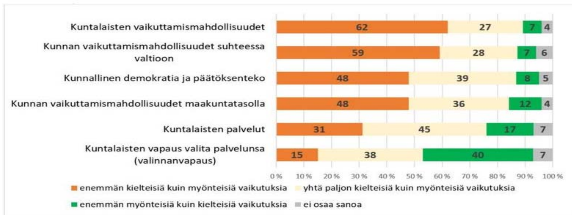
Kuvio. Kuntapäätäjien arviot sote- ja maakuntauudistuksen vaikutuksista eri asioihin syksyllä 2017. Vastausten %-jakaumat ARTTU2-tutkimuskunnissa, n=192-193.