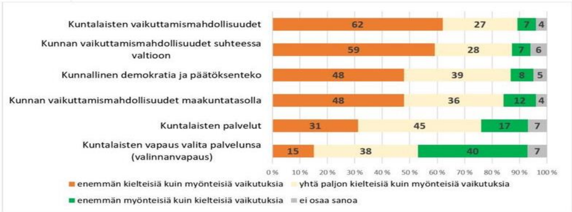
Kuvio. Kuntapäätäjien arviot sote- ja maakuntauudistuksen vaikutuksista eri asioihin syksyllä 2017. Vastausten %-jakaumat ARTTU2-tutkimuskunnissa, n=192-193.