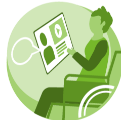
Vammaisten ihmisten oppiminen