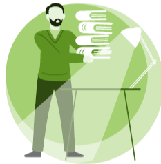
Opetus-, ohjaus- ja muu henkilöstö