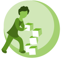
Varhaiskasvatus sekä esi- ja perusopetus