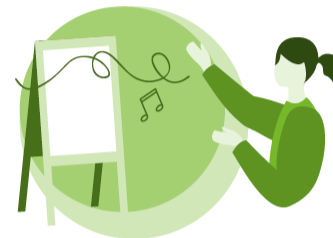
Taide- ja kulttuurikasvatus ja -opetus ja taiteen perusopetus