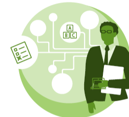
Maahanmuuttajataustaisten oppiminen ja oppimispolut