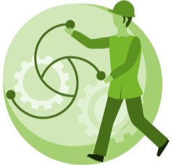
Jatkuva oppiminen – työuran aikainen oppiminen