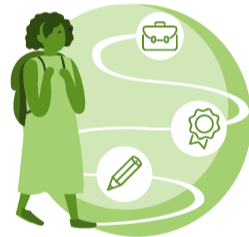
Ruotsinkielisen koulutuksen tilanne, tavoitteet ja toimenpiteet