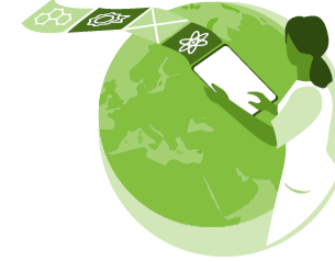
Tiede ja tutkittu tieto