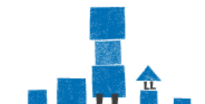
YHDEN VANHEMMAN PERHEET