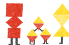
KAKSOS- JA KOLMOSPERHEET