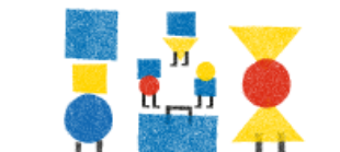
KAHDEN KULTTUURIN PERHEET