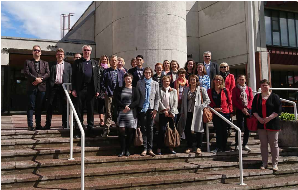
Kuntaliiton kv- ja EU-verkosto vieraili Svetogorskissa Imatran tapaamisen yhteydessä kesäkuussa 2018.

Imatran kaupunki kutsui verkoston koolle 70-vuotisjuhlien kunniaksi vuoden 2018 ensimmäiseen tapaamiseen. Imatralla tutustuttiin erityisesti rajat ylittävään yhteistyöhön. Ohjelmaan sisältyi käynti Svetogorskissa, jossa kaupunginjohtaja, piirijohdaja ja valtuuston puheenjohtaja esittelivät yhteistyötä Imatran ja Lappeenrannan kanssa.