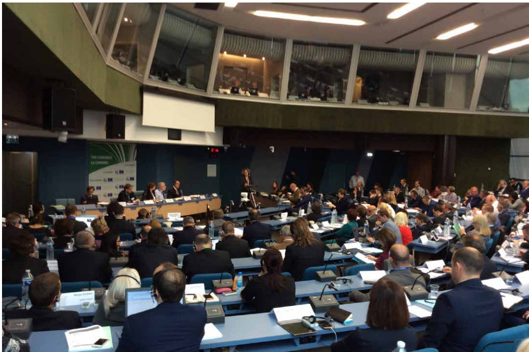
Euroopan neuvoston kunta- ja aluehallintokongressi maaliskuussa 2019.

Euroopan neuvoston kunta- ja aluehallintokongressi on myös Euroopan vanhin virallinen kuntien ja alueiden yhteistyöelin. Euroopan neuvosto perusti kongressin vuonna 1957, mistä lähtien Suomenkin kuntajärjestöt lähettivät sinne tarkkailijoita. Suomesta tuli neuvoston jäsen vuonna 1989, mistä lukien Suomi on lähettänyt kongressiin viralliset edustajansa.