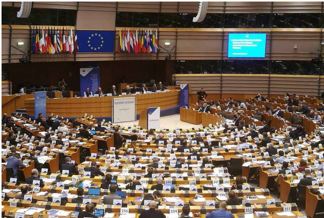
Alueiden komitean täysistunto.

Alueiden komitean jäsenet pitää olla alueellisen tai paikallisen julkisyhteisön vaaleilla valittuja edustajia tai heidän tulee olla poliittisesti vastuussa vaaleilla valitulle elimelle. Komiteassa on 9 suomalaista jäsentä ja varajäsentä. Yksi jäsen ja varajäsen nimitetään Ahvenanmaan ehdotuksesta. Jäsenet nimittää EU:n neuvosto. Valtioneuvosto tekee neuvostolle esityksen Suomea edustavista jäsenistä. Valtioneuvosto on tehnyt esityksensä neuvostolle Kuntaliiton hallituksen nimitysehdotuksen mukaisesti. Komitean seuraava toimikausi alkaa tammikuussa 2020.