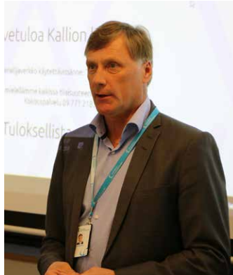
Kuntaliiton toimitusjohtaja (28.2.2019 asti) selvitti näkymiä Kuntaliiton tulevaisuudesta.