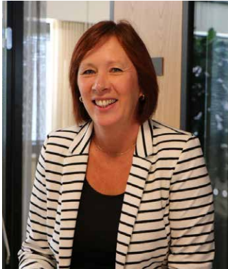
Kuntaliiton hallituksen puheenjohtaja Sirpa Paatero kertoi Kuntaliiton roolista kansainvälisenä toimijana.