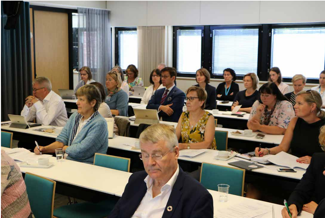
Valtuuskuntien jäseniä ja Kuntaliiton asiantuntijoita.