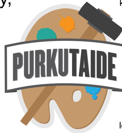
logo: Jouni Väänänen