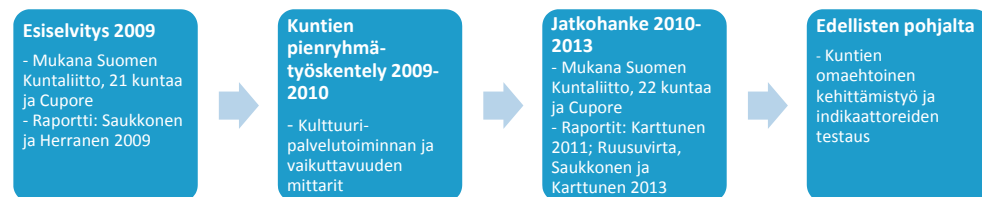
Kuvio 1. Kuntien kulttuuripolitiikan seurannan ja arvioinnin kehittämishankkeen eteneminen

Esiselvityksen valmistuttua syksyllä 2009 hankekaupungit jatkoivat kehittämistyötä keskenään kahdessa pienryhmässä, joista toinen keskittyi kulttuuripalvelutoiminnan ja toinen vaikuttavuuden mittareihin. Syksyllä 2010 Suomen Kuntaliitto teki Cuporen kanssa sopimuksen jatkaa esiselvityksessä aloitettua kehittämistyötä. Jatkohankkeeseen lähti mukaan 22 kaupunkia. Mukaan lähtivät Kajaania lukuun ottamatta esiselvityksessä mukana olleet kaupungit sekä uusina kaupungeina Helsinki ja Pori. Jatkohankkeen tavoitteeksi tuli muodostaa kaikille soveltuva, tarkoin määritelty ja standardoitu indikaattorikokoelma, jonka ympärille