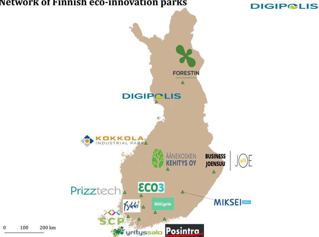
Network of Finnish eco-innovation parks