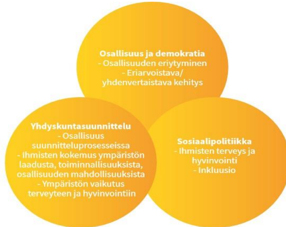
Kuvio 1. Teoreettisia lähestymistapoja sosiaalisesti kestäviin kaupunkeihin.