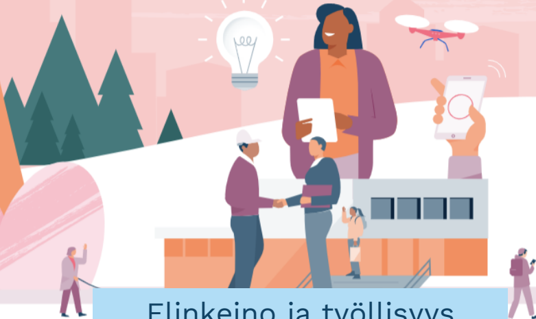
Elinkeino ja työllisyys