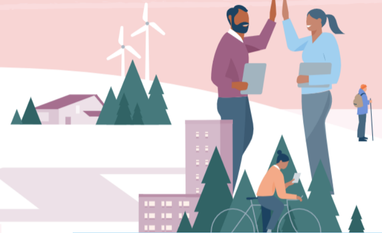
Kehittäjä ja kumppani