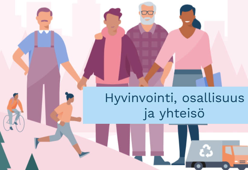
Hyvinvointi, osallisuus ja yhteisö