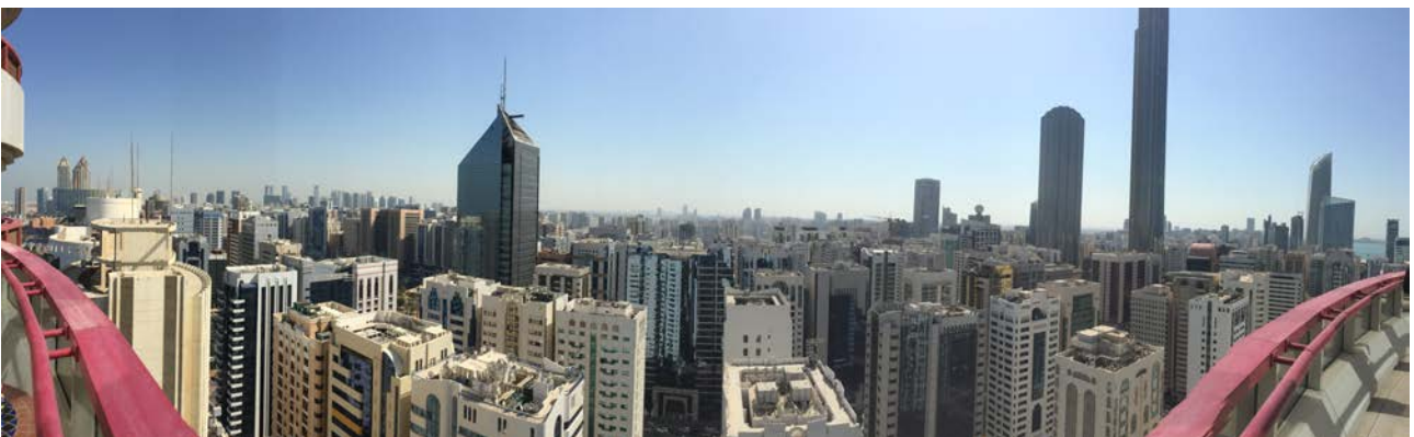
Abu Dhabin kaupunkinäkömää suurlähetystön parvekkeelta (23. krs).