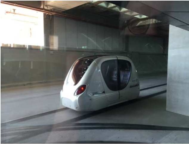
Masdarin innovaatiokeskuksen itsestään liikkuvat "autot" (PRT).