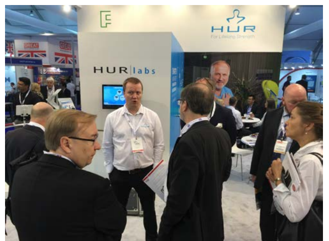
Kokkolalainen Hur Labs on ihmisen fyysisen suorituskyvyn testaamiseen ja seurantaan tarkoitettujen laitteiden ja ohjelmistojen johtava yritys maailmassa.