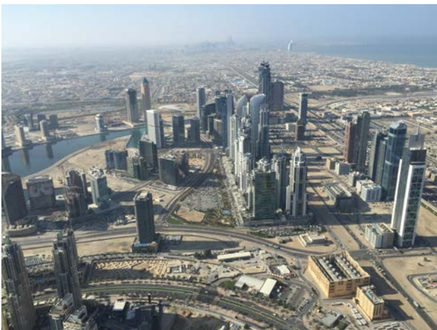
Dubain kaupunkinäkömää 456 m korkeudesta (Burj Khalifa, maailman korkein rakennus; kokonaiskorkeus 825 m).