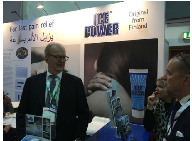
IcePower on osallistunut terveystalouksille jo toistakymmentä kertaa.