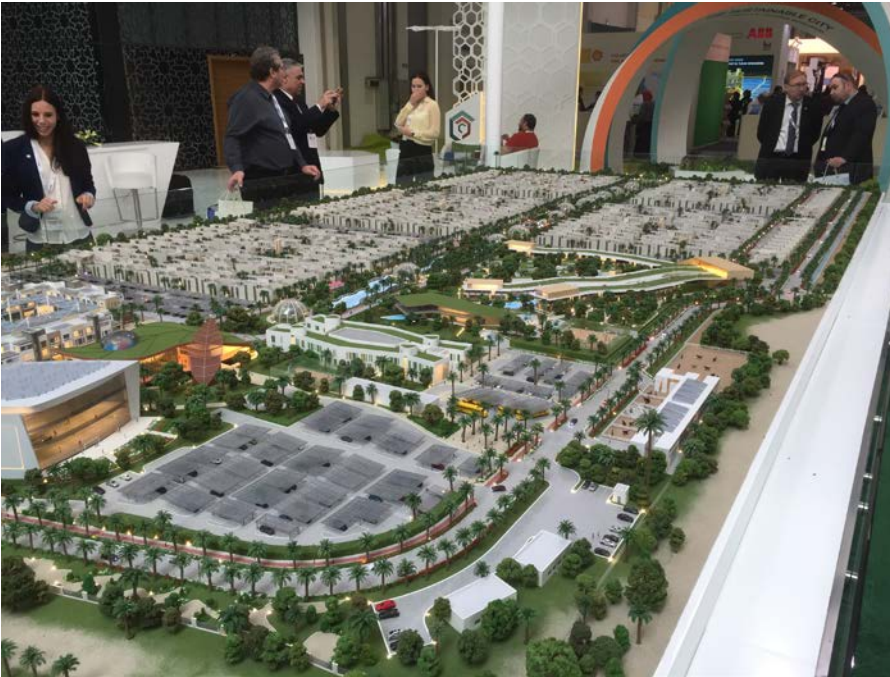
Kestävän kehityksen messujen pienoismalli aurinkopaneeleista energiansa keräävästä muutamien tuhannen asukkaan kaupungista.