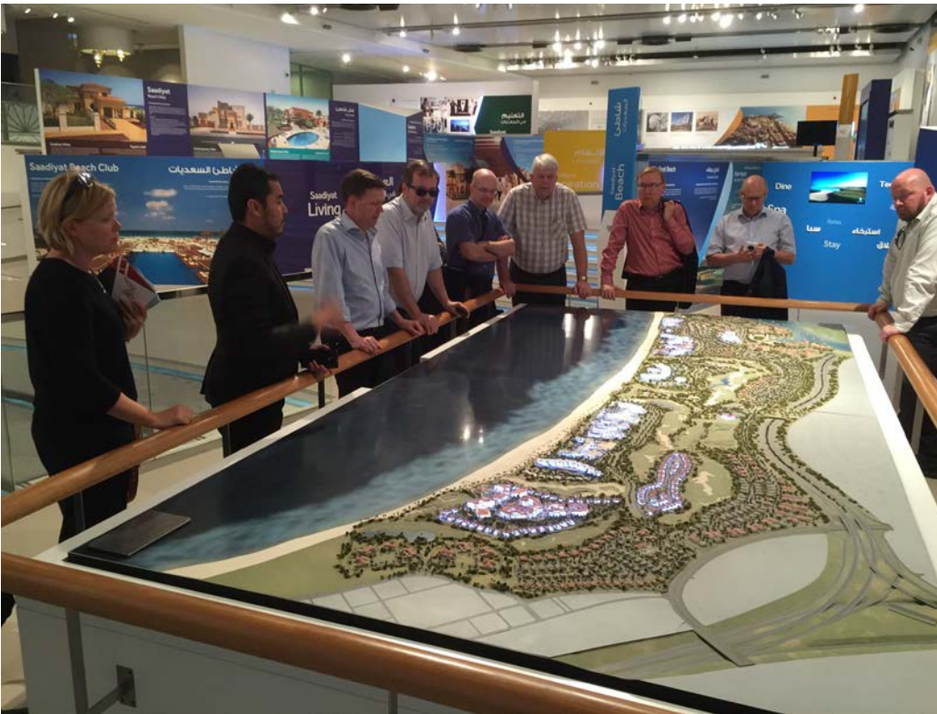
Pienoismalli Saadiyatinsaaren alueesta, jonne on mittavat rakentamissuunnitelmat.